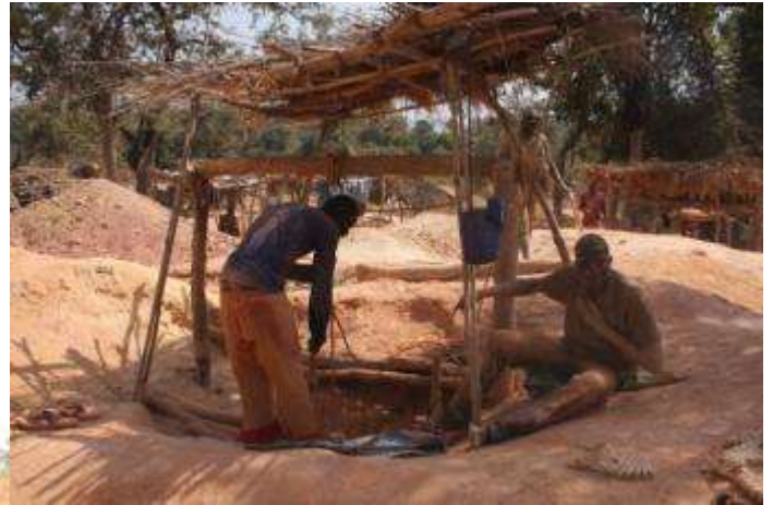
En haut les orpailleurs de Makó et ci-contre le marché de Kédougou et la piscine de l'hôtel Bedick de Kédougou.